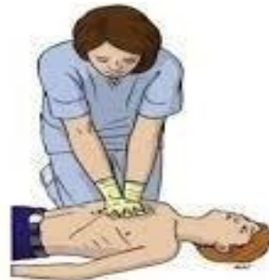
8 años o más