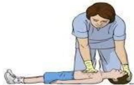
Menor a 8 años

En niños menores de 8 años solo se utiliza una mano para realizar las compresiones